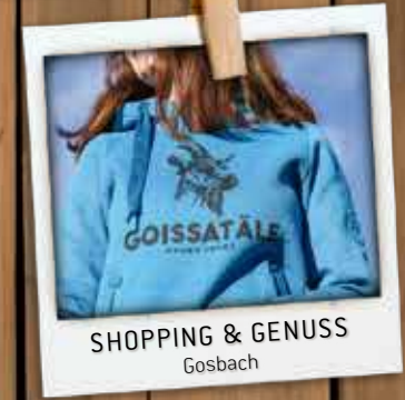
SHOPPING & GENUSS Gosbach

📍 Leimbergstraße 73342 Bad Ditzenbach - Gosbach