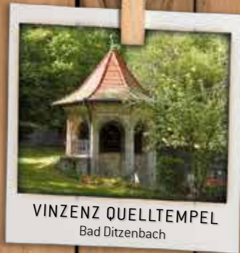
VINZENZ QUELLTEMPEL Bad Ditzenbach

📍 Wanderparkplatz Burgsteige 73342 Bad Ditzenbach