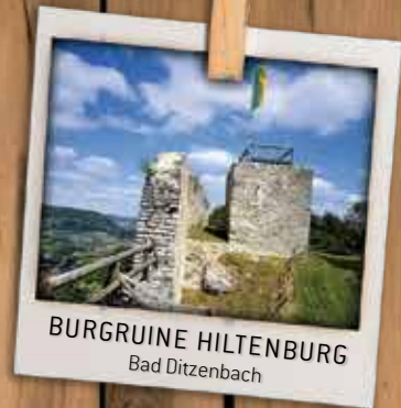
BURGRUINE HILTENBURG Bad Ditzenbach

Nach einem Fußweg von ca. 45 Minuten erreichen sie die Burgruine Hiltenburg auf dem Schlossberg oberhalb von Bad Ditzenbach. Der Aufstieg wird belohnt mit einer herrlichen Aussicht auf Bad Ditzenbach und ins Obere Filstal. Von April bis Oktober haben Sie immer sonntags die Möglichkeit die Ausstellung "Geschichte im Turm - 1000 Jahre Hiltenburg" im Bergfried des Vorderen Schlosses zu besuchen. Dort können Sie sich auf zwei Ebenen über die Geschichte der Hiltenburg informieren.