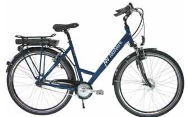
Modell TOUR Y